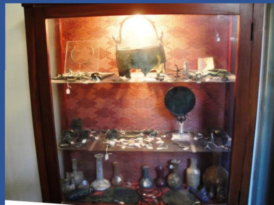
Armadio con reperti in bronzo, in vetro e in avorio.