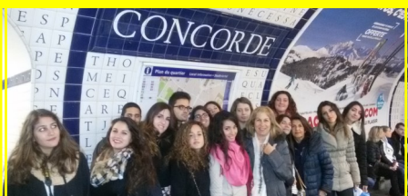
Soggiorno studio all'estero